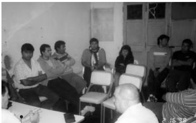
En reunión con los compañeros de Villa Dolores