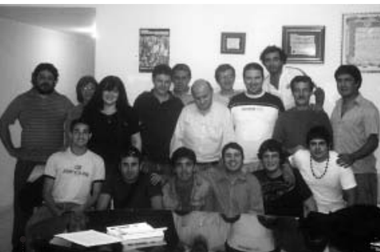
Luego de la reunión en Río IV, los compañeros posaron para la foto.