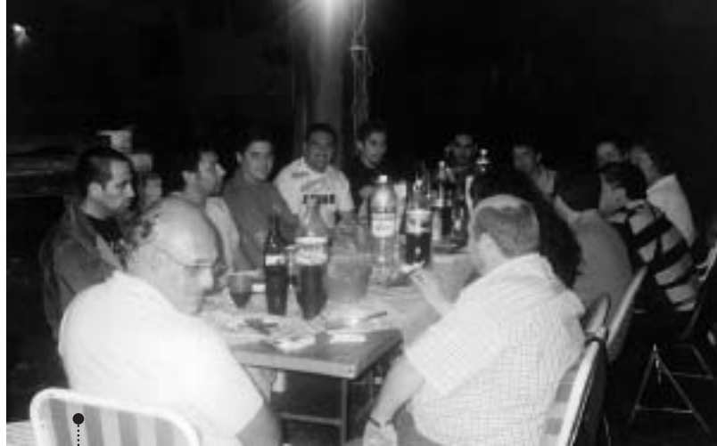
Reunidos con los compañeros de Cosquín

SABADO 19 DE ABRIL DE 2008 – 9.00 HORAS – CASA DE DESCANSO DE LOS TRABAJADORES GRAFICOS EN SAN ANTONIO DE ARREDONDO