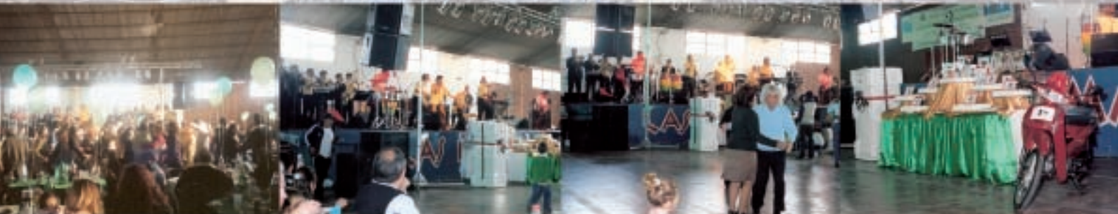
IMAGENES DE LA FIESTA DEL DIA DEL GRAFICO REALIZADO EL 11 DE MAYO DE 2007

LOS TRABAJADORES GRAFICOS DE CORDOBA REAFIRMAMOS UNA VEZ MAS NUESTROS DERECHOS CON EL FIRME COMPROMISO DE SEGUIR UNIDOS, JUNTO A TODO EL MOVIMIENTO OBRERO, LUCHANDO POR SALARIOS, POR LA JUSTA DISTRIBUCION DE LA RIQUEZA Y POR EL RESPETO AL CONVENIO COLECTIVO DE TRABAJO.