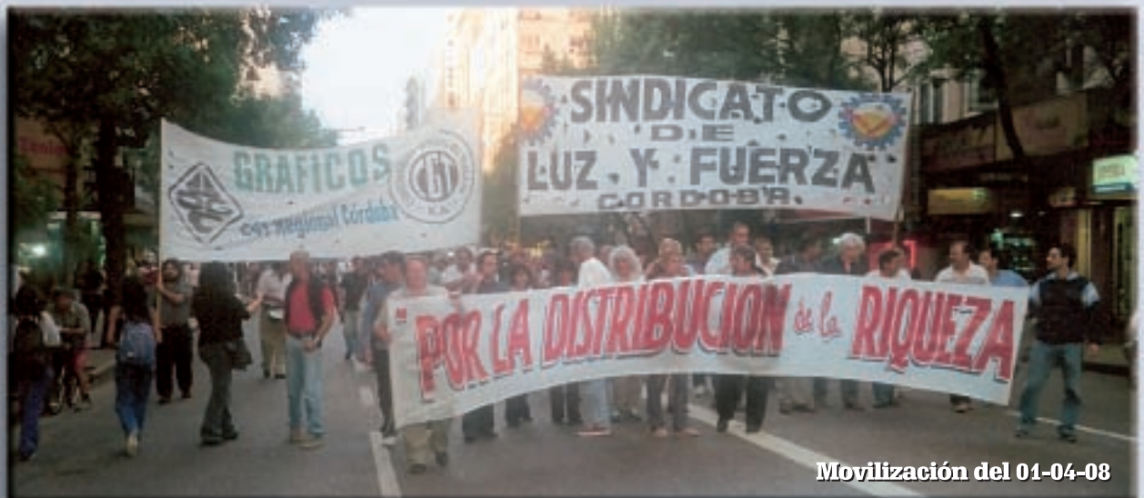
Movilización del 01-04-08