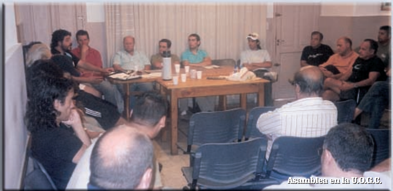
Asamblea en la U.O.G.C.