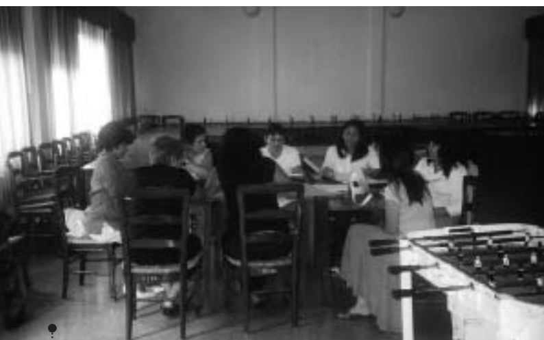
Trabajo en comisiones