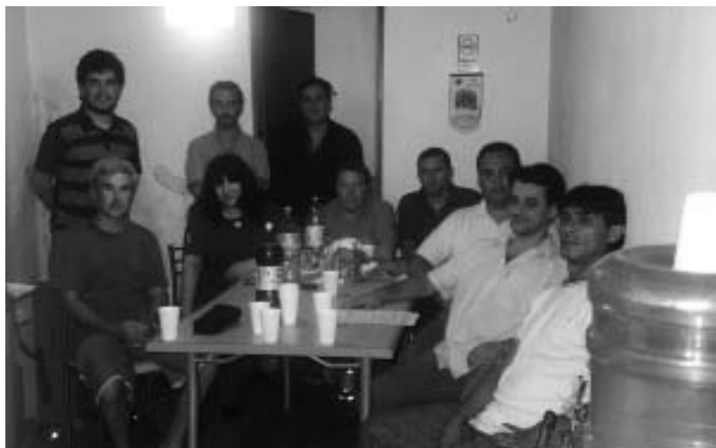
Reunidos con los compañeros de San Francisco