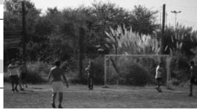
UNION ALTA CORDOBA jugando un amistoso.