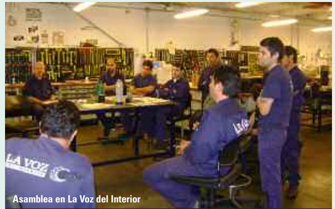
Asamblea en La Voz del Interior

presentación gremial tomó conocimiento de lo expresado por la patronal, rechazando lo vertido, intimando al pago inmediato de la suma acordada y haciendo las reservas legales y convencionales. Se notificó audiencia, donde posteriormente presentó los recibos con el pago de lo intimado. Continúan las actuaciones.