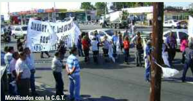
Movilizados con la C.G.T.

Los trabajadores de Offset Nis y la UOGC permanecerán en la calle, frente a la planta de Avda. La Voz