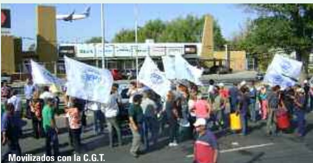
Movilizados con la C.G.T.

del Interior 7921, adonde convocan a todas las organizaciones sindicales y sociales a acompañar solidariamente esta lucha y a oponerse firmemente a la reiteración de estos lamentables hechos que indican un serio avance sobre las libertades y los derechos constitucionales”.