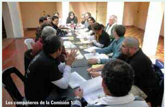
Los compañeros de la Comisión 1

La modalidad de trabajo propuesta fue que el grupo se dividiera en tres comisiones, abordando los temas del orden del día: 1º) Análisis de los convenios colectivos de trabajo y la correcta liquidación de los salarios; 2º) Propuestas para modificar las condicio-