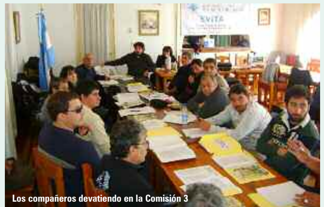
Los compañeros devatiendo en la Comisión 3

Asimismo, propuso formar comisiones tripartitas para determinar las características de los insumos como tintas, barnices, químicos, UV, líquidos desengrasantes, etc. y de qué manera pueden afectar la salud tanto del trabajador como producir daño ambiental al ser desechadas sin tratamientos previos.