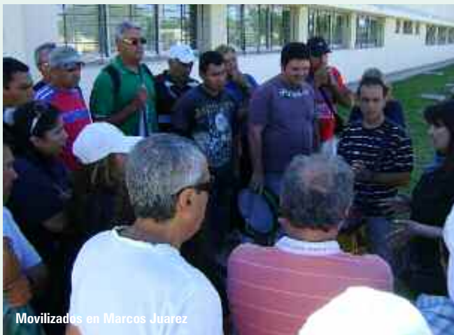
Movilizados en Marcos Juárez

Toda lucha gremial sienta su precedente en algún aspecto. En el caso de la de los compañeros de Offset Nis, seguramente va a quedar –y no sólo en la historia de la UOGC- como una muestra de lo