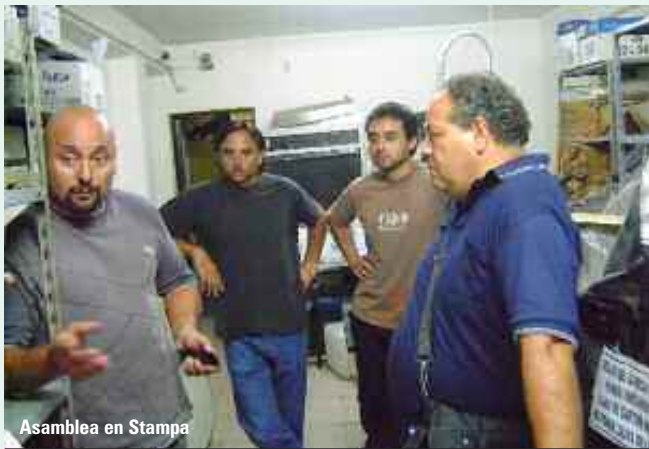
Asamblea en Stampa

sin reconocerle a la empresa los motivos de la solicitud, se llegó a un acuerdo por tres meses, sin afectar los derechos laborales. Siguen las actuaciones.