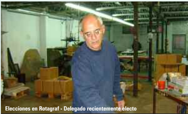
Elecciones en Rotagraf - Delegado recientemente electo