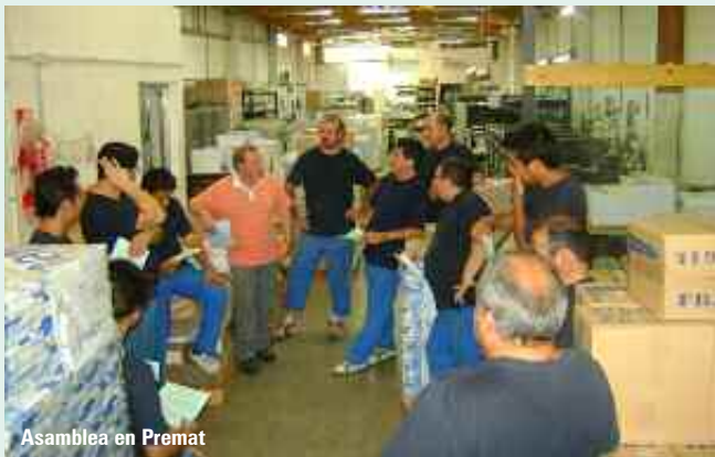
Asamblea en Premat

nueva fecha de audiencia. Continuando las actuaciones, la empresa presentó la documentación, corroborando las condiciones convencionales en que se encuentran los trabajadores. La representación gremial tomó conocimiento de la documentación exhibida y se le notificó la resolución 1638 (actualización de Art. 5º del CCT 409/05, intimándose a la aplicación de nuestro convenio, elevándose las actuaciones a la superioridad para su resolución.}