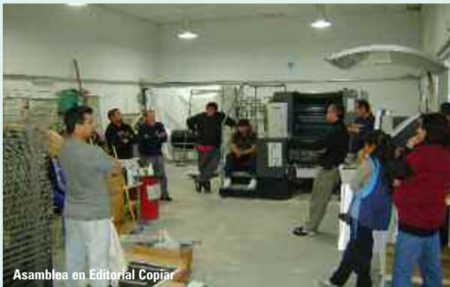
Asamblea en Editorial Copiar

IBERSA S.R.L: Se realizó inspección general a los fines de verificar documentación laboral, encontrándose personal no registrado. Se intimó a la registración del trabajador, a lo que la empresa manifestó que el trabajador se encuentra registrado solicitando tiempo prudencial para presentar la documentación requerida. La UOGC accedió a lo solicitado, fijándose fecha de audiencia. Continúan las actuaciones.