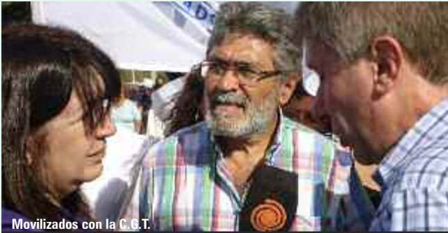
Movilizados con la C.G.T.

Una especial mención merece la actuación judicial y policial en la madrugada del 25 de abril frente a la sede de la empresa, que fuera denunciada por la