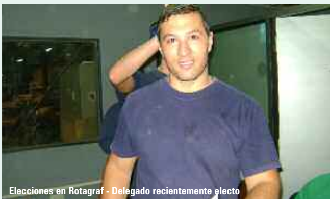
Elecciones en Rotagraf - Delegado recientemente electo

MARTINEZ RISOTTO S.R.L.: La empresa solicitó plazos para la presentación de la documentación laboral, argumentando que la contadora se encontraba de viaje. La UOGC tomó conocimiento de lo manifestado, accediendo al pedido y solicitó que se fije fecha de audiencia. Siguen las actuaciones.