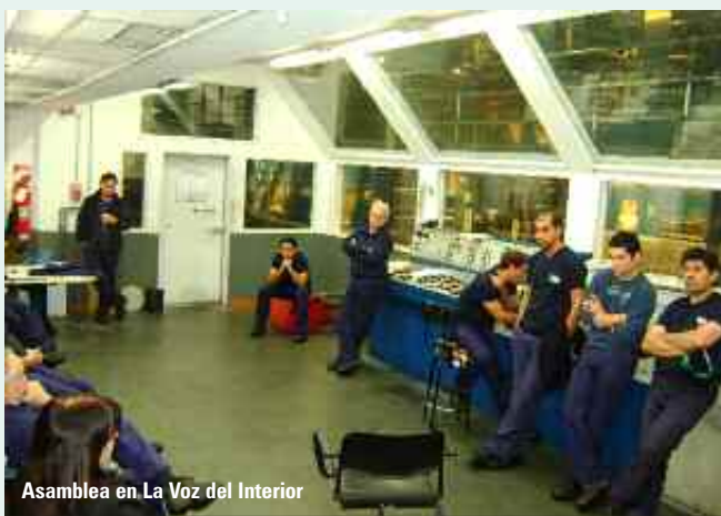
Asamblea en La Voz del Interior

PLOT S. A.: Siguiendo con las actuaciones, la empresa presentó la documentación cumpliendo con el compromiso asumido en audiencias anteriores, asignando nueva categoría a un trabajador, juntamente con el pago de los $ 500.00 correspondientes al mes de marzo de 2013. La UOGC tomó conocimiento de la documentación exhibida, ratificando las categorías restantes y haciendo las reservas convencionales. Continúan las actuaciones.