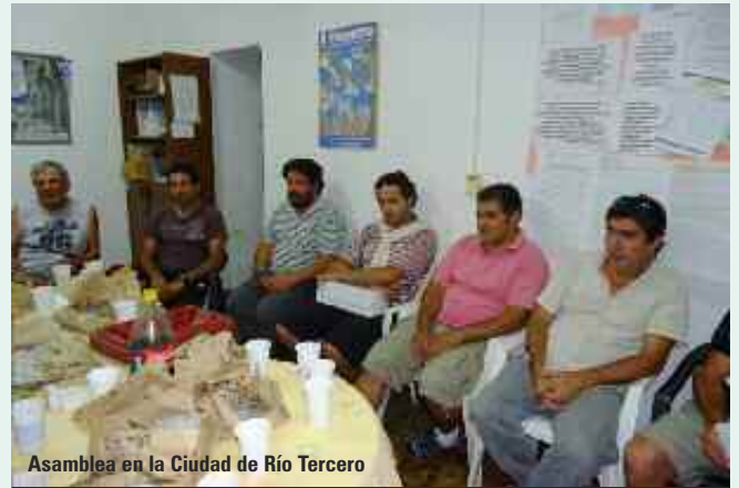
Asamblea en la Ciudad de Río Tercero