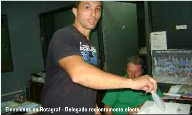
Elecciones en Rotagraf - Delegado recientemente electo

ALBRE S. A. (OCEÁNICA SERVICIOS GRÁFICOS): Continuando con las actuaciones la empresa presentó la documentación con el pago de los $500 no remunerativos correspondientes a marzo de 2013 por tres trabajadores. La UOGC tomó conocimiento de lo exhibido y ratificó el pedido de recategorización. Continúan las actuaciones.