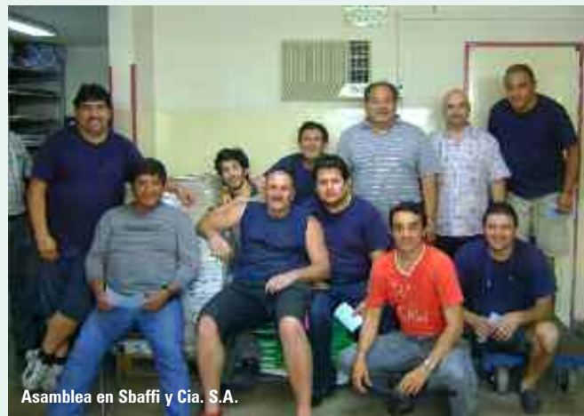
Asamblea en Sbaffi y Cia. S.A.