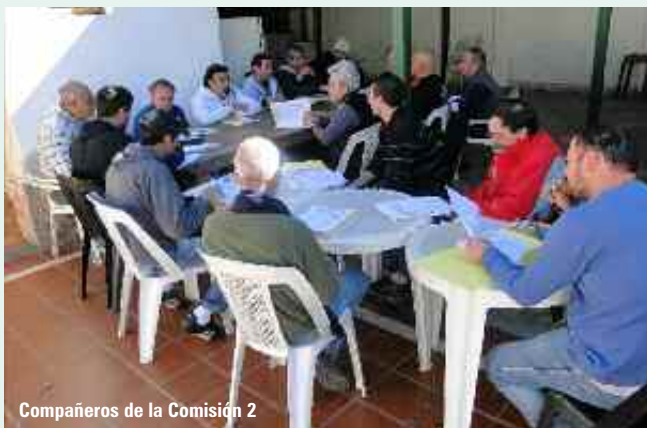
Compañeros de la Comisión 2

1) Que se modifique el Art. 34º del CCT 409/05 en un sentido aclaratorio sobre la forma correcta de liquidar las vacaciones, evitando que se confunda con el criterio que se utiliza con los empleados de comercio. Al mismo tiempo, que se insista que las mismas se tienen que abonar al momento en que el trabajador salga. 2) Que se mencionen los términos del inciso a) del Art. 78º en el Art. 28ª sobre cómo se tiene que aplicar la escala salarial. 3) Que se insista en la modificación del porcentaje de bonificación por antigüedad, tomando como referencia una de las categorías intermedias, en lugar de la que tenemos actualmente. 4) Solicitar se establezca el presentismo en todas las empresas. 5) Establecer la tolerancia por llegadas tarde cuando existan factores ajenos a la voluntad del trabajador que no le permiten llegar a tiempo. 6) Establecer que las revisiones o gestiones a realizar ante la ART deben ser efectuadas en los horarios habituales de trabajo y no afectar el tiempo libre del trabajador. 7) Incorporar días hábiles por nacimiento de hijo.