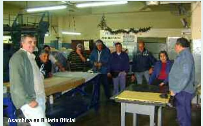
Asamblea en Boletín Oficial

GRAFICA MUSUMECI S.R.L: Se realizó inspección a los fines de constatar el pago de $500.00 no remunerativos, que la empresa no había hecho efectivos, aludiendo que no estaba notificada. En el mismo acto fue notificada de lo acordado, y la empresa se comprometió al pago inmediato de la suma en cuestión. La UOGC tomó conocimiento de expresado por la patronal haciendo las reservas legales y convencionales y luego la empresa presentó los recibos con el pago de la suma intimada. Siguen las actuaciones.