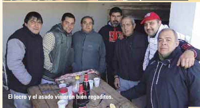
El locro y el asado vinieron bien regaditos.