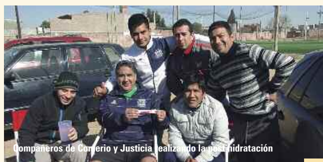
Compañeros de Comercio y Justicia realizando la post hidratación