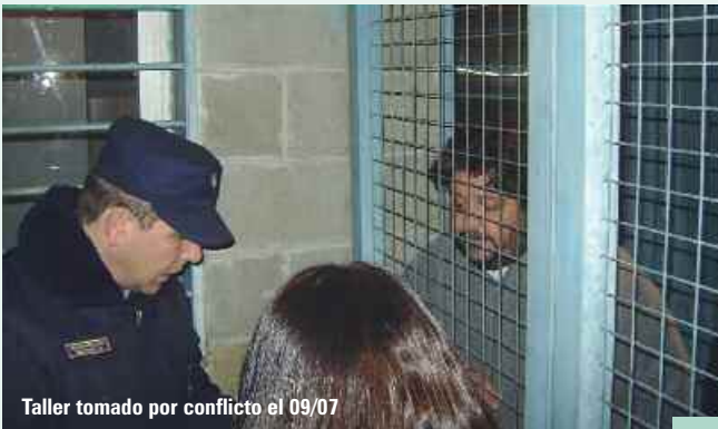
Taller tomado por conflicto el 09/07