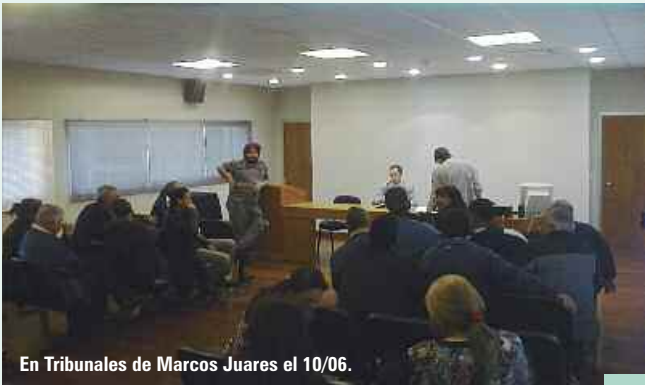
En Tribunales de Marcos Juarez el 10/06.