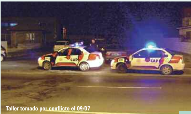
Taller tomado por conflicto el 09/07