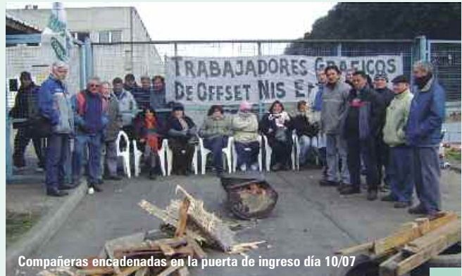
Compañeras encadenadas en la puerta de ingreso día 10/07

En esa instancia, los trabajadores y la UOGC fueron nuevamente