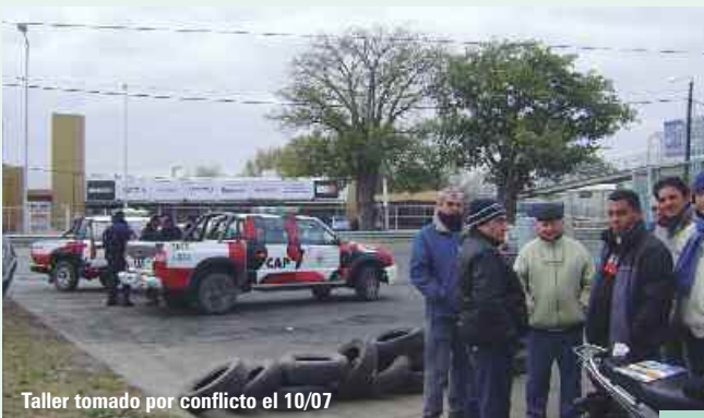
Taller tomado por conflicto el 10/07