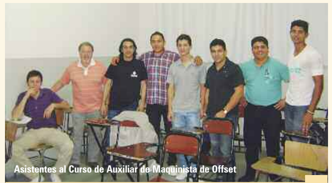
Asistentes al Curso de Auxiliar de Maquinista de Offset