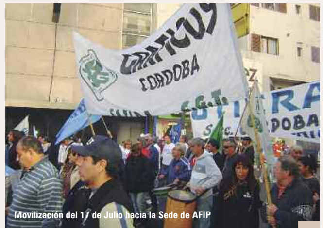
Movilización del 17 de Julio hacia la Sede de AFIP

sentativo para ejercer la representación de los intereses colectivos.