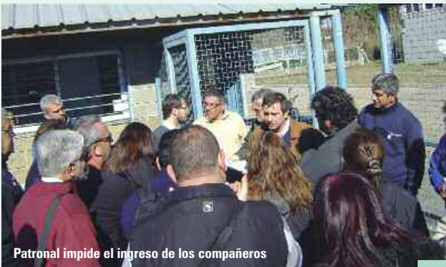
Patronal impide el ingreso de los compañeros