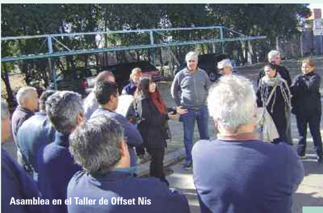
Asamblea en el Taller de Offset Nis

semestre. La UOGC tomó conocimiento de lo expuesto por la empresa y constatando la falta de pago del SAC intimó a la firma de que se abone lo adeudado, y para que tenga y mantenga en lugar de trabajo la documentación solicitada. En actuación posterior, se corroboró el pago del correspondiente al SAC primer semestre, y se relevaron los datos del personal que se encontraba prestando tareas, verificando la presencia de personal no estaba registrado. Se intimó a su correcta registración intimándolo en los términos de lo establecido por la ley 24013, haciendo las reservas correspondientes. Continúan las actuaciones.