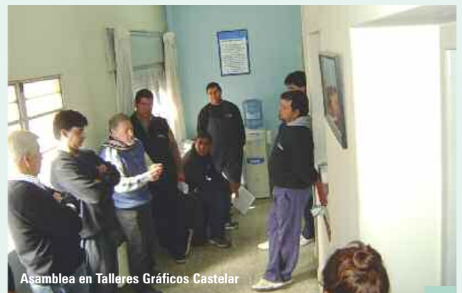
Asamblea en Talleres Gráficos Castelar

LAPENTA WALTER (GENTE DE GRAFICA): Se realizó inspección general, tomándose nómina del personal donde se detectaron dos (2) trabajadores no registrados. Se intimó a la firma la registración del personal relevado, en los términos de la ley 24013, y se solicitó se fije fecha de audiencia a los efectos de que presentara la documentación intimada. En la audiencia, presentó parte de la documentación con la registración de un trabajador y telegrama de renuncia del otro. La UOGC tomó conocimiento de lo exhibido, quedando a la corroboración de lo presentado por la patronal, solicitando una nueva fecha de audiencia. Siguen las actuaciones.