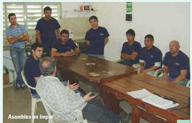
Asamblea en Impar