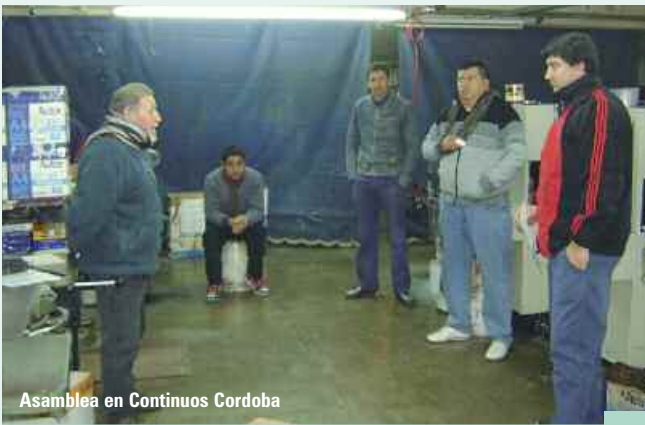
Asamblea en Continuos Cordoba

W D S.A.: Se realizó inspección general, entrevistando a los trabajadores que se encontraban prestando tareas en la empresa. La representación empresaria solicitó un tiempo para presentar la documentación exigida, y el gremio accedió a otorgar los plazos solicitados, fijando fecha de audiencia. En la misma, la empresa presentó la documentación intimada, y de su verificación surgió que los salarios se encontraban erróneamente liquidados, existiendo también una defectuosa categorización de los trabajadores. Se intimó a la correcta liquidación de los salarios y a la aplicación de las escalas salariales vigentes y la corrección de las categorías por las que efectivamente corresponden de acuerdo a las tareas que cumplen sus trabajadores. Se fijó nueva fecha de audiencia. Continúan las actuaciones.