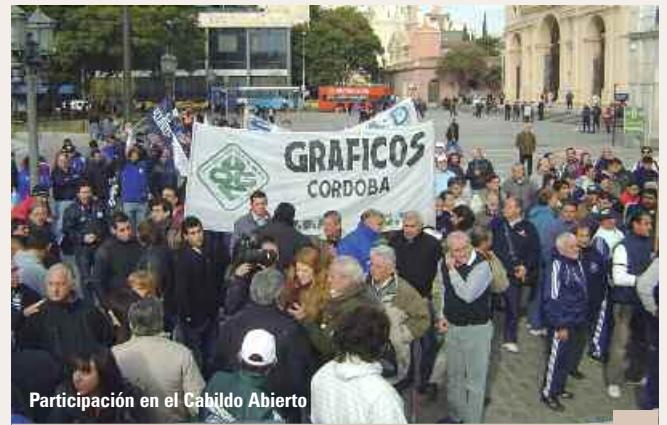
Participación en el Cabildo Abierto

Trabajamos para la unidad del movimiento obrero, cuyas divisiones han puesto en peligro la continuidad del modelo sindical argentino, que es referencia a nivel mundial por haber conservado condiciones y legislación que le otorgan a los trabajadores posibilidades de obtener una mejor distribución del ingreso y el poder del reconocimiento de las funciones sindicales. La vulnerabilidad de un movimiento obrero debilitado y en un marco de división y atomización sindical, no nos dejan lugar a dudas sobre su defensa incondicional.