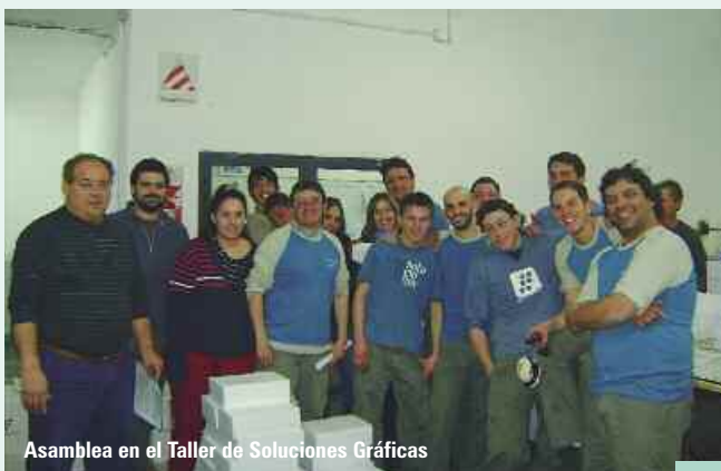
Asamblea en el Taller de Soluciones Gráficas

BERMUDEZ IMPRESIONES S.R.L: Continuando con las actuaciones, la empresa presentó la documentación por los últimos seis meses y SAC primer semestre. La representación gremial tomó conocimiento de lo exhibido y observó que no se efectuaron los descuentos por los Art. 56 y 57 del CCT 409/05 y la incorrecta liquidación de los salarios. Se intimó a la inmediata regularización de lo observado, comprometiéndose la empresa a corregir y poner en orden dicha circunstancia. Siguen las actuaciones.