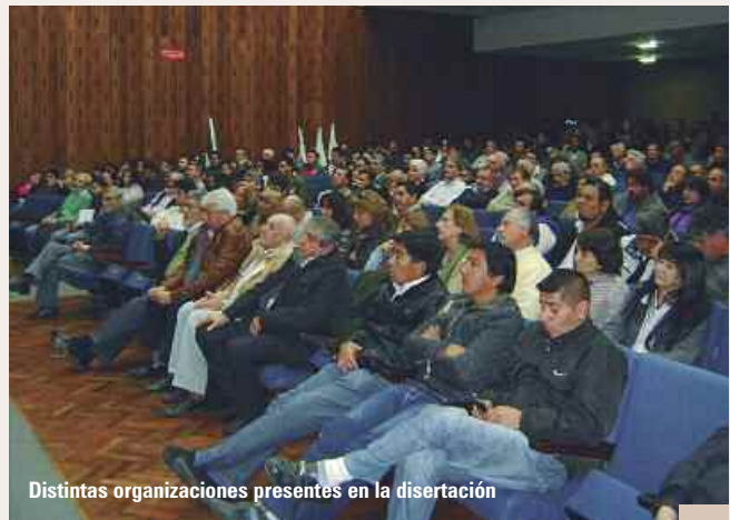
Distintas organizaciones presentes en la disertación