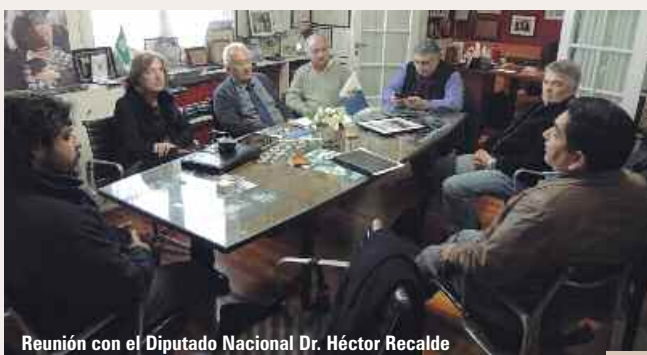
Reunión con el Diputado Nacional Dr. Héctor Recalde

Destacamos la importancia del accionar conjunto de los sindicatos que integran la CGT Regional, que han mantenido la unidad por sobre toda otra cuestión ajena a los verdaderos intereses de los trabajadores que representan.