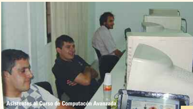
Asistentes al Curso de Computación Avanzada