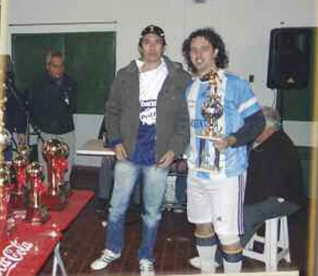
Premio Valla Menos Goles