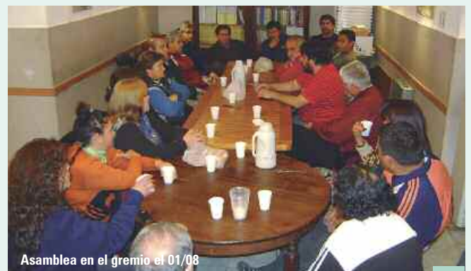
Asamblea en el gremio el 01/08

Hoy las dificultades no han sido superadas, porque el daño producido a la empresa ha sido mucho. Junto al síndico y al juez, desde la UOGC apostamos a que esa fuente de trabajo vuelva a ser digna y que no vuelva a caer en manos de impresentables y estafadores que solamente buscaron hacer su negocio con los bienes que resumen también el trabajo acumulado por tantos años de muchos compañeros.