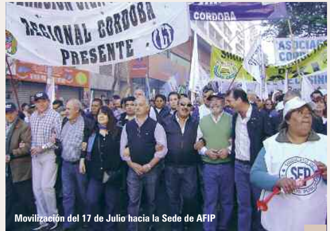
Movilización del 17 de Julio hacia la Sede de AFIP

6.- Los ataques al Modelo Sindical Argentino, que se expresan en políticas del Estado e incluso en fallos de los más altos niveles del Poder Judicial de la Nación, que atacan el principio central del Modelo Sindical, esto es el privilegio del sindicato más repre-