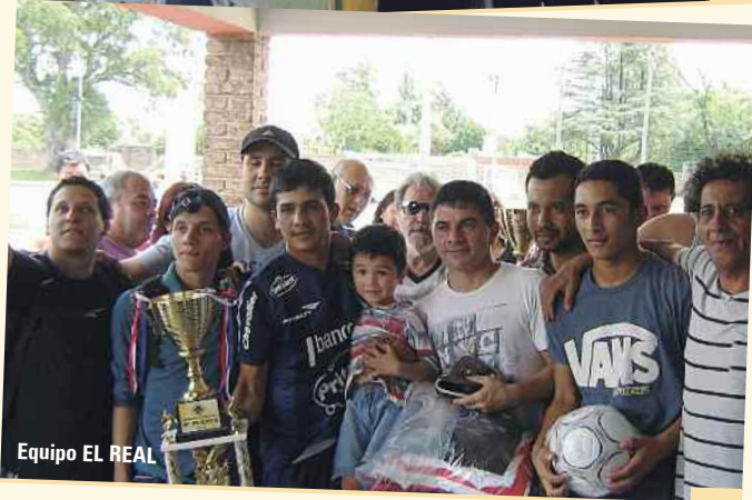
Equipo EL REAL