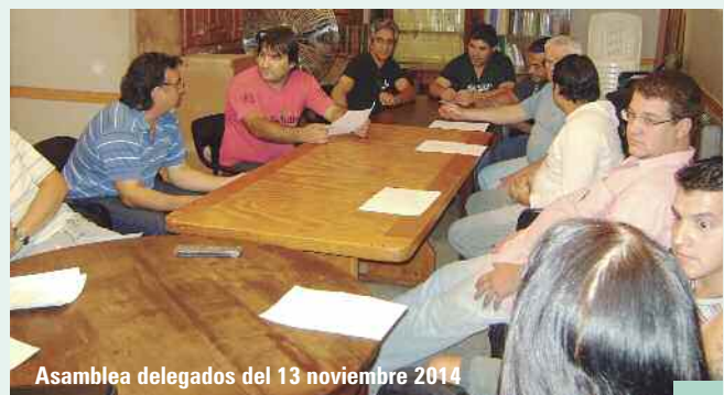
Asamblea delegados del 13 noviembre 2014