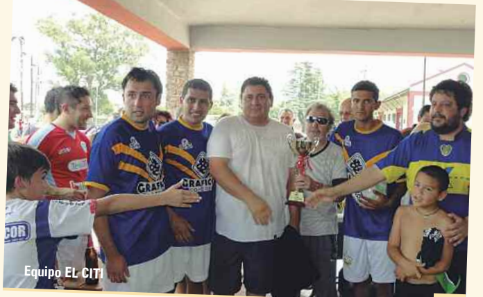
Equipo EL CITI