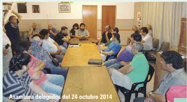
Asamblea delegados del 24 octubre 2014

MASTERS S.R.L: Continuando con las actuaciones, la empresa presentó la documentación denunciada, aclarando la relación que sostiene con los números de CUIT que utiliza para facturar una parte de los trabajos. Expresó que no tienen peso en la economía empresaria, aclarando los valores en cuestión. Con respecto a los trabajadores, manifestó que se mantendrán inalterables las condiciones laborales y económicas que vienen teniendo. La UOGC y los trabajadores tomaron conocimiento de las declaraciones por la patronal y luego, reunidos en asamblea decidieron acompañar a la empresa en algunas medidas –que no afectan derechos ni condiciones- planteadas para asegurar la continuidad de la fuente laboral, haciendo las reservas legales y convencionales correspondientes.