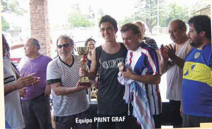
Equipo PRINT GRAF