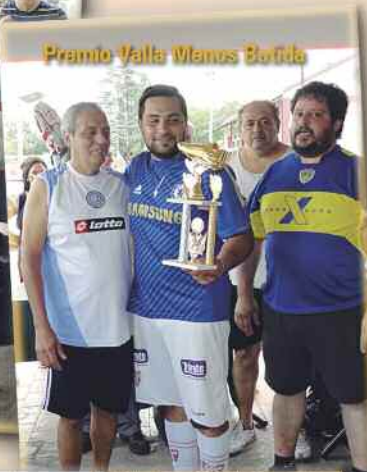
Premio Valla Manos Borrada