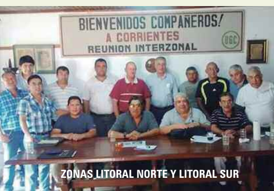
ZONAS LITORAL NORTE Y LITORAL SUR

A continuación el debate se desarrolló alrededor de la respuesta elevada por FAIGA al pedido de Compensación Salarial. Se consideró