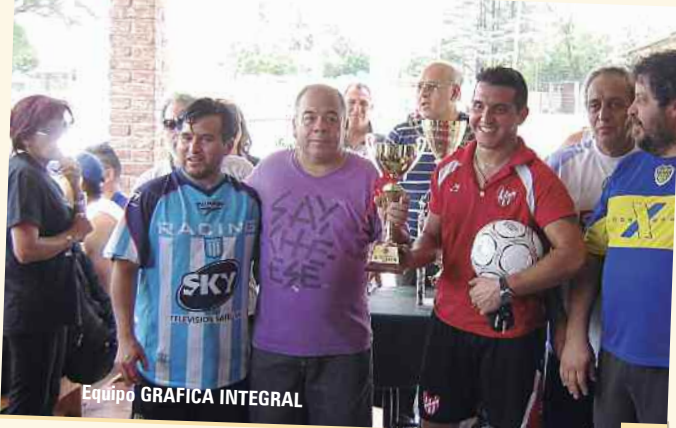
Equipo GRAFICA INTEGRAL