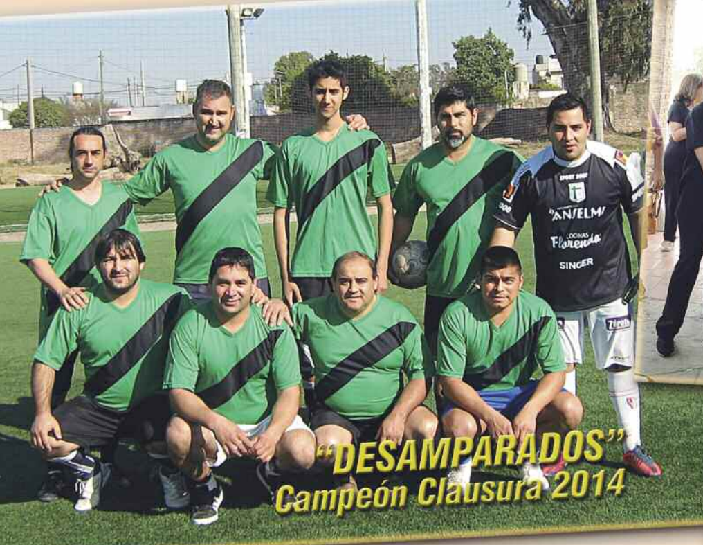
"DESAMPARADOS" Campeón Clausura 2014