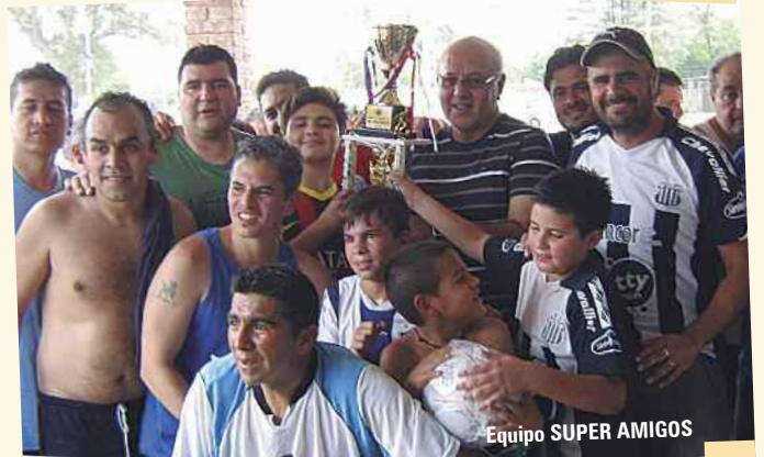
Equipo SUPER AMIGOS