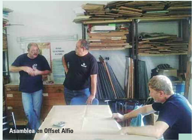
Asamblea en Offset Alfio

Se realizó inspección general, tomando nómina de los trabajadores que se encontraban prestando tareas en la empresa. La misma solicitó plazos para presentar la documentación y la UOGC tomó conocimiento de lo actuado, accediendo al pedido de la patronal. De las actuaciones surgió que dentro del plantel de trabajadores, tres de ellos realizan tareas de impresión y están bajo otro convenio de trabajo, por lo que se intimó a la empresa a la correcta registración y la aplicación del CCT 409/05, solicitando se fije una audiencia. La empresa presentó la documentación intimada en acto inspectivo y exhibió recibos de haberes de los trabajadores en cues-