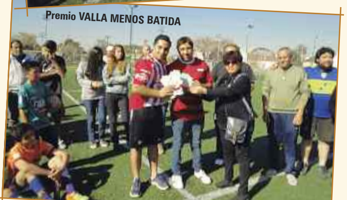
Premio VALLA MENOS BATIDA