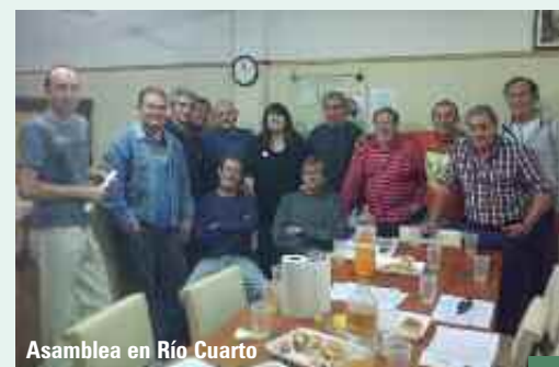
Asamblea en Río Cuarto