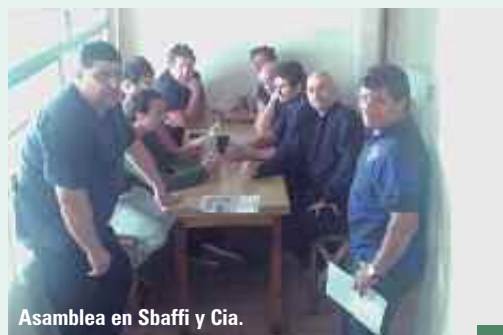
Asamblea en Sbaffi y Cia.