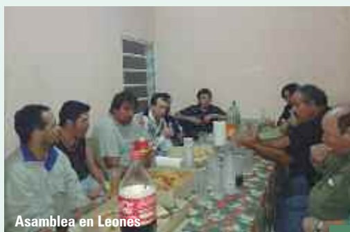
Asamblea en Leones