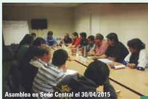
Asamblea en Sede Central el 30/04/2015