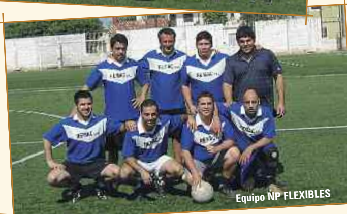
Equipo NP FLEXIBLES