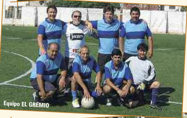
Equipo EL GREMIO