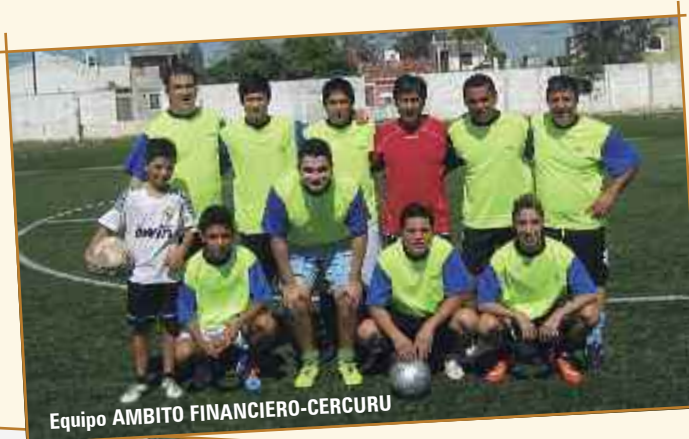
Equipo AMBITO FINANCIERO-CERCURU