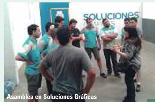
Asamblea en Soluciones Gráficas