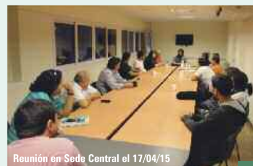
Reunión en Sede Central el 17/04/15