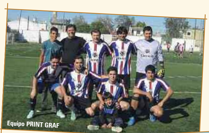
Equipo PRINT GRAF