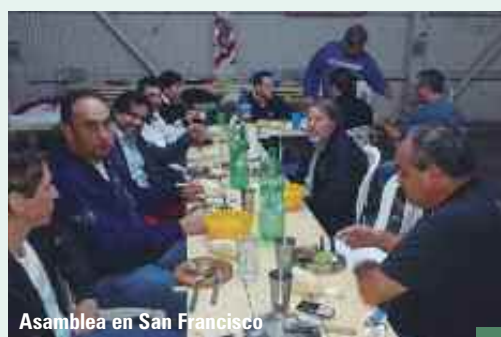
Asamblea en San Francisco