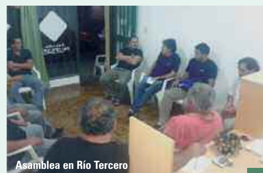
Asamblea en Río Tercero

CONSULTORES DE EMPRESAS DIVISION SERVICIOS SRL: En audiencia, la representación patronal exhibió contrato de seguro de vida obligatorio, ART, F 931 AFIP y recibos de haberes correspondientes al mes de mayo/2015. La UOGC tomó conocimiento, ratificando la intimación sobre la recategorización que corresponde a los trabajadores y la corrección de las liquidaciones de sueldos. Continúan las actuaciones.