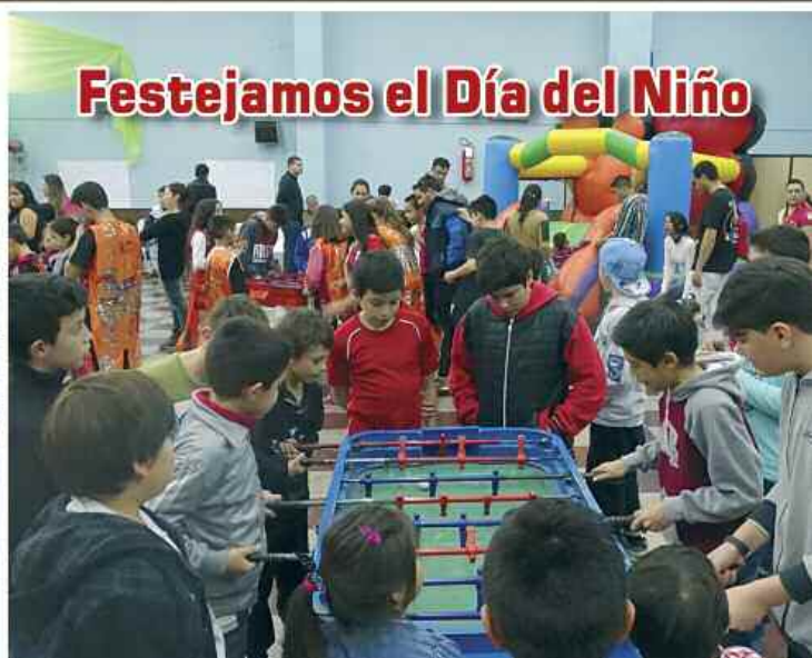
Festejamos el Día del Niño