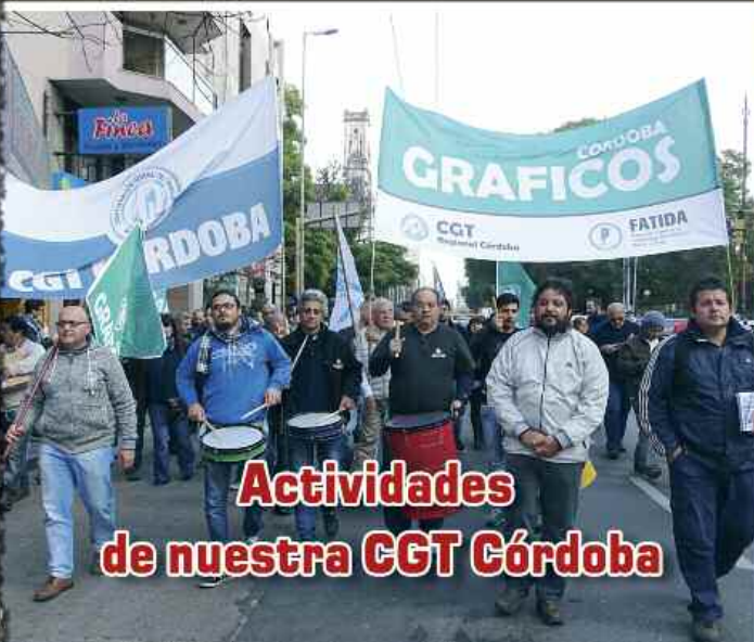
Actividades de nuestra CGT Córdoba