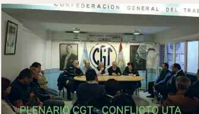
PLENARIO CGT - CONFLICTO UTA