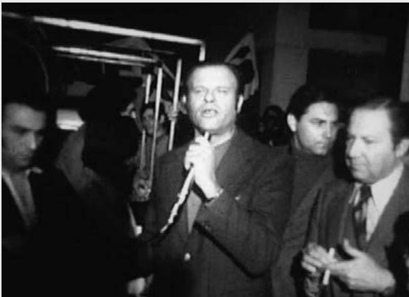
Parte de la multitud que acompañó el cortejo fúnebre hacia el cementerio San Jerónimo.