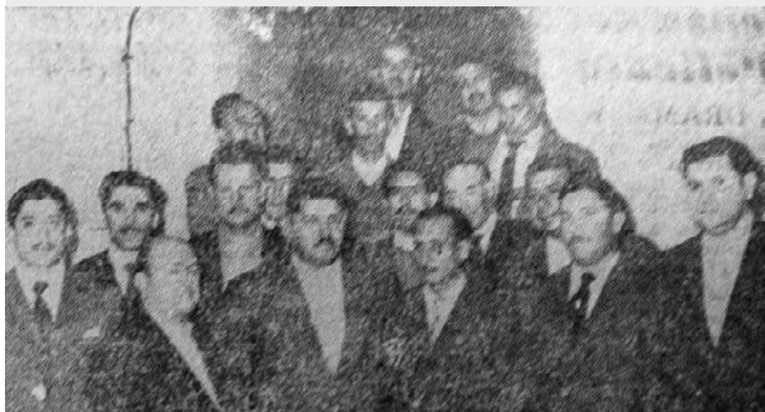
Lista Amarilla, al centro Atilio López. Se impuso en las elecciones normalizadoras de UTA Córdoba en diciembre de 1956