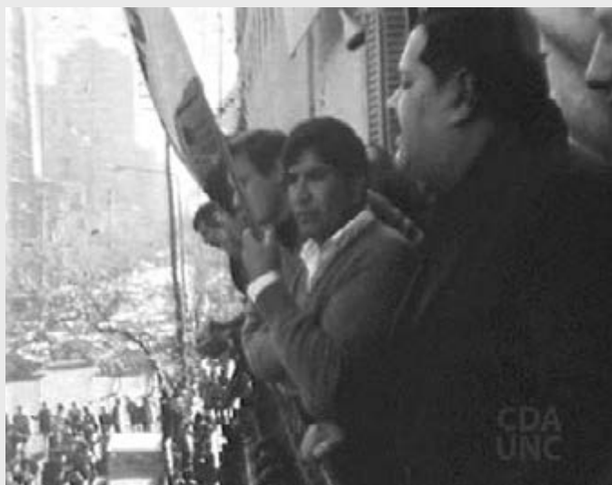
28-04-71. Liberan a gremialistas y estudiantes. López habla desde el balcón de la CGT. Imagen digitalizada de video, archivo filmico C10 - Centro Documentación Audiovisual- Facultad de Filosofía y Humanidades de la Universidad Nacional de Córdoba.