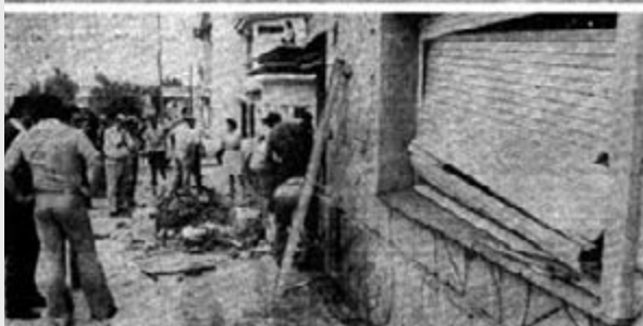
Imágenes publicadas en distintos diarios de El Navarrazo, la policía en armas contra las autoridades.