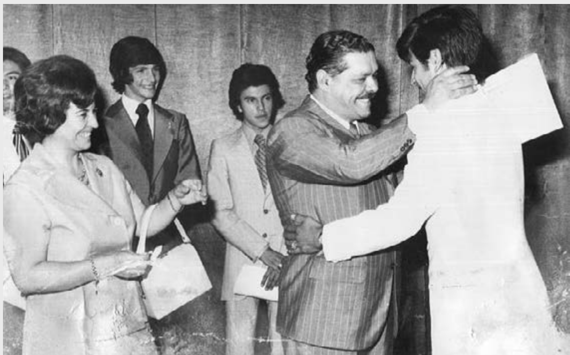
Como Vice Gobernador le entregó el título de secundario a su hijo y a la promoción completa.