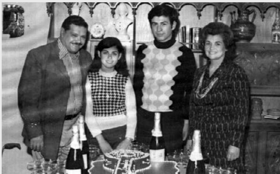
Ultima foto en familia, cumpleaños 18 de su hijo, mes de mayo de 1974