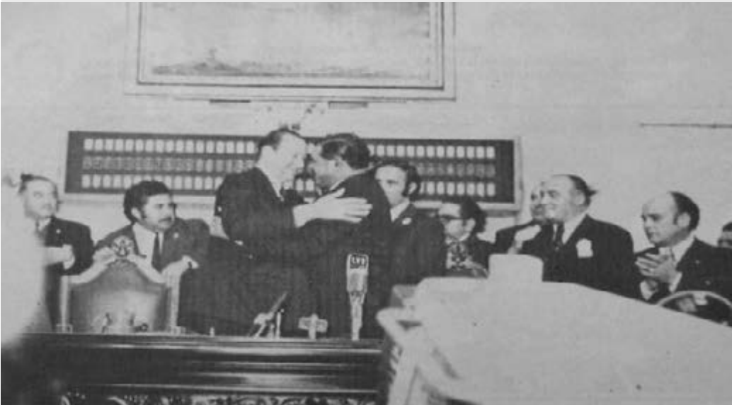
Abrazándose con Ricardo Obregón Cano luego de jurar como Gobernador y Vice Gobernador ante la Asamblea Legislativa. 25 de Mayo de 1973.