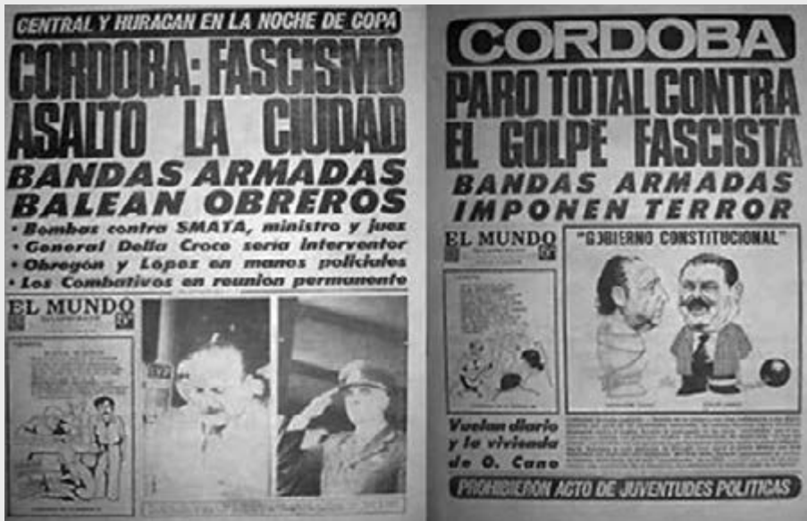
Tapa diario El Mundo cuando se produce “El Navarrazo”; un jefe de policía que destituye al gobierno Constitucional de Córdoba, Perón era el presidente de la Nación.