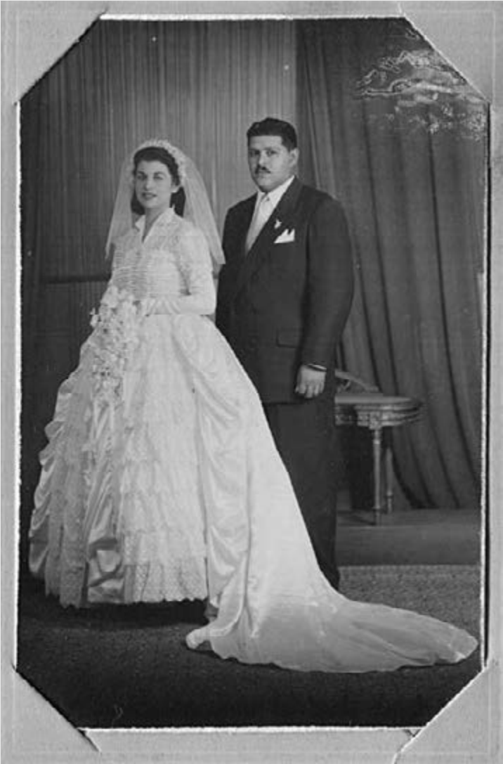
Casamiento Ceremonia Religiosa.